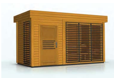
kolor: jasny dąb, antracyt