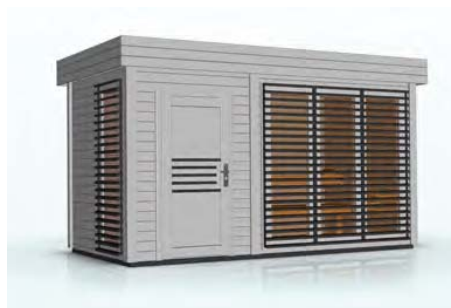
kolor: jasny szary, antracyt