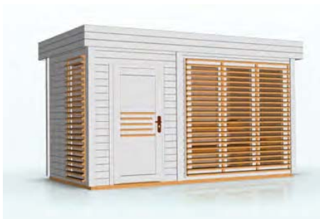
kolor: biały, jasny dąb